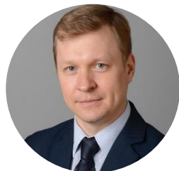
Иванов Андрей Юрьевич Первый заместитель Министра экономического развития РФ