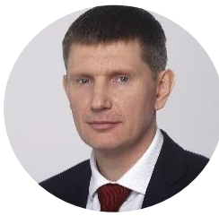
Решетников Максим Геннадьевич Министр экономического развития РФ